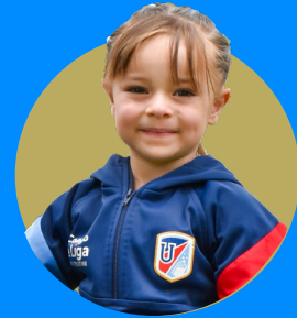
Inicial I y II (desde los 3 años)

Jornada extendida y extracurriculares: 14h30 a 16h00