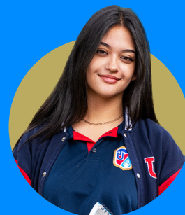
Bachillerato en Ciencias (1º a 3º BGU)