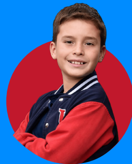
Educación General Básica (1º a 10º EGB)